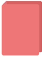
Un gros classeur au choix (dos 8 cm)