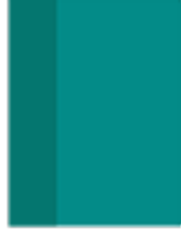
Une pochette A4 avec velcro , pression ou tirette