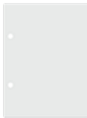
Un bloc de feuilles de dessins (24 x32 cm)