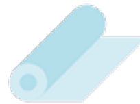
Papier adhésif pour recouvrir les livres et les cahiers. (A garder à la maison, il faudra recouvrir seulement après la rentrée )