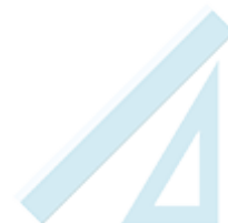
une règle de 30cm et une de 15 cm +une équerre Aristo