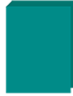
Un classeur au choix (dos 4 cm)