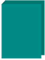
Un classeur vert (dos 4 cm)