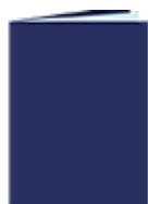
Une farde à devis