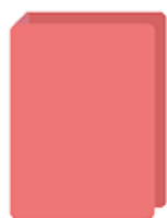
Un gros classeur au choix (dos 8 cm)