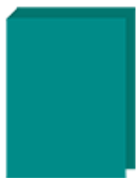
Un classeur souple au choix (dos 4 cm)