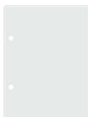
Un bloc de feuilles de dessins (24 x32 cm)