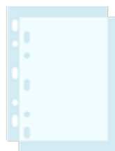
Un paquet de chemises transparentes