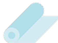
Papier adhésif pour recouvrir les livres et les cahiers. (A garder à la maison, il faudra recouvrir seulement après la rentrée )