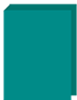
Un classeur vert (dos 4 cm)