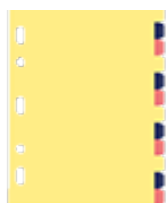
2x12 intercalaires en carton