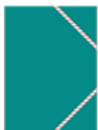
Un farde à rabats (pour les avis)